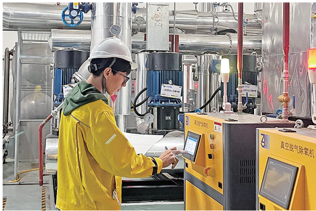
新奥燃气的供热管家在调试设备。