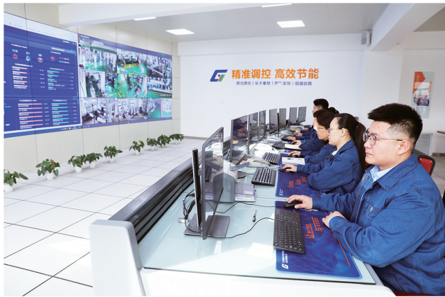
西海岸公用事业集团能源公司指挥调度中心紧盯控制屏。