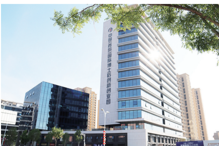
青岛国际博士后创新创业园。