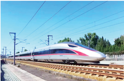
城阳重点培育发展轨道交通产业。