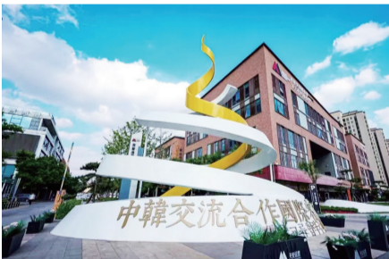
位于城阳的中韩交流合作园。