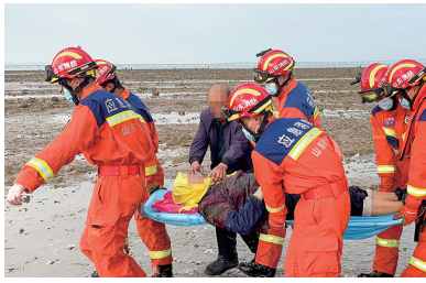
昏迷老人被转移至安全区域。

早报11月11日讯 11日13时58分,开发区消防救援大队119指挥中心接到救援警讯,位于西海岸新区黄岛街道法家园村东部的胶州湾海域有人员被困,情况十分紧急。接警后,指挥中心立即调派海河路消防站前往救援。