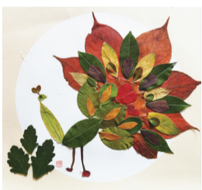
《树荫下的彩翎》 柳京辰