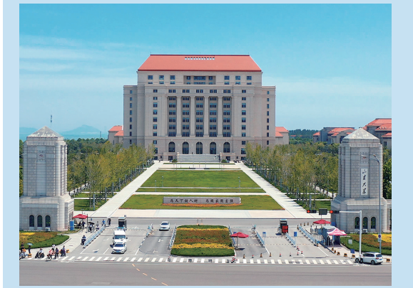
山东大学青岛校区西门。