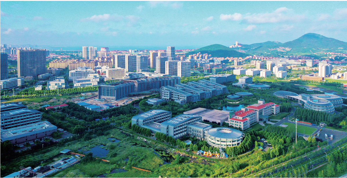
在青岛蓝谷“国字号”科研机构云集。

这里就是青岛蓝谷,一座宜居宜业宜游的蓝谷新城,正在鳌山湾畔加速崛起。作为青岛市委、市政府主动承担国家海洋强国战略而打造的海洋科技创新高地,青岛蓝谷正锚定“海洋科学城”发展目标,通过一系列创新举措,凝聚砥砺奋进的磅礴力量,不断将科技创新优势转化为产业发展胜势,强力推动产城融合、民有所居、居有所乐。