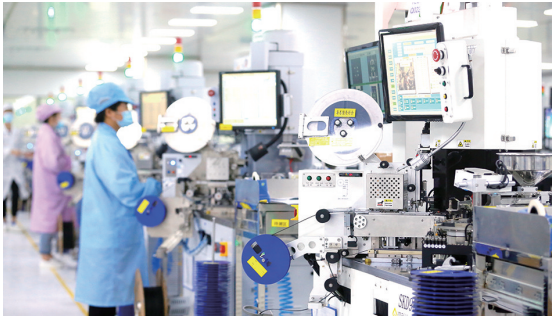
即墨新一代信息技术产业从无到有,引进建成惠科半导体、泰睿思微电子等企业和项目40余个,图为泰睿思微电子生产车间。