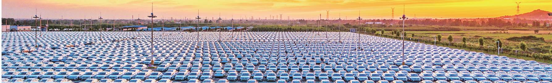
即墨一汽-大众产业园。

2022年,对于古城即墨来说,是特殊的一年——撤市设区5周年,“即墨区”五周岁。