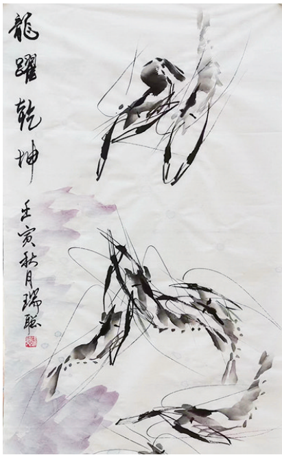
绘画 王瑞 61岁 市军休服务中心