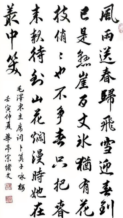
书法 宗绪文 59岁