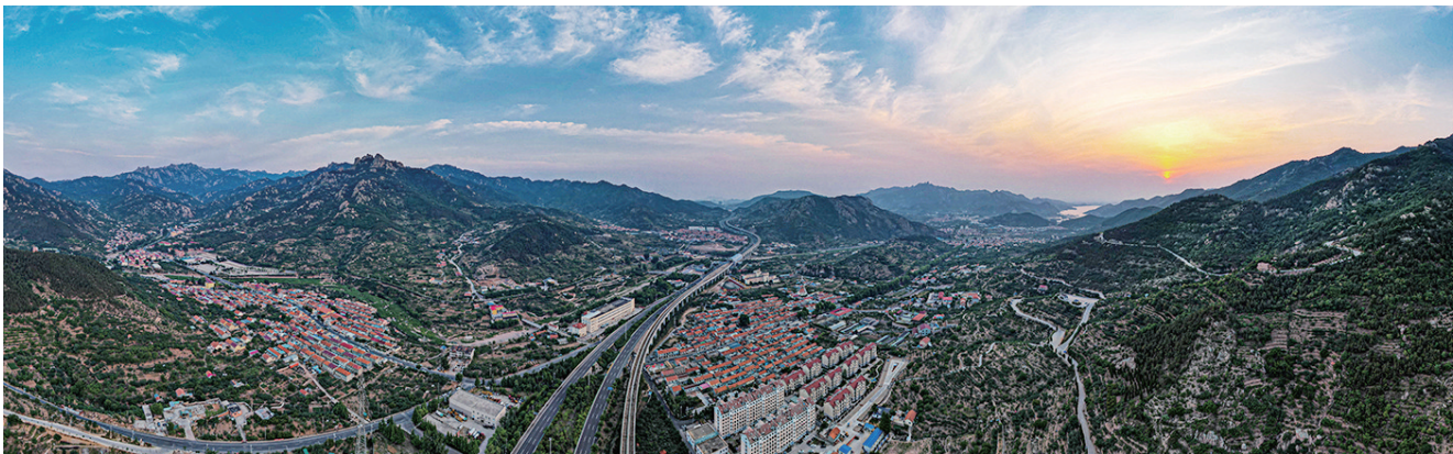
摄影《北九水地铁站》陈宁 63岁 市老干部活动中心