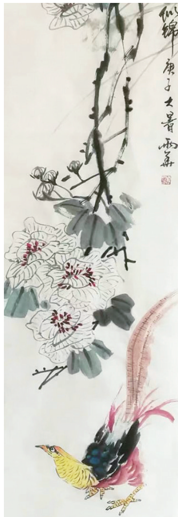
绘画 李雨华 67岁 市军休服务中心