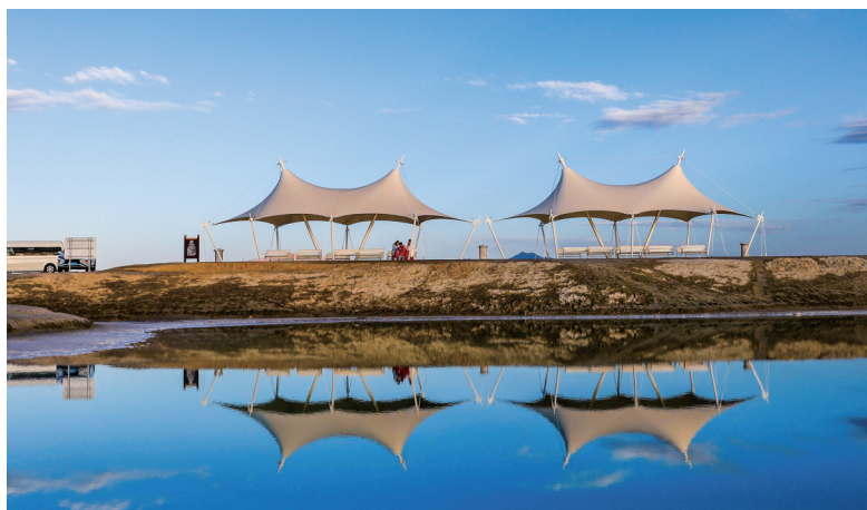
摄影《翡翠湖边》朱海东 65岁 市老干部活动中心