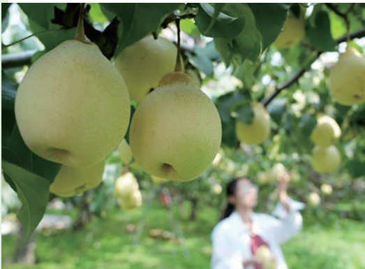
近郊体验采摘的乐趣。

国庆假期已经走远,出游大军现在也都回归了正常的生活,上班的已经到岗,上学的已回归课堂,随着出行人数的减少,景点也不再是人挤人。加上秋季气候宜人,最佳错峰出游正当时。记者在采访中了解到,十一过后,会迎来一个短暂的旅游淡季,游客较少,体验感会更好。