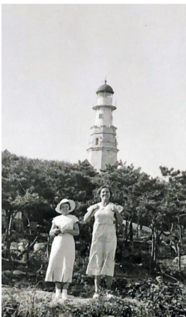
游人在小青岛灯塔前留影。