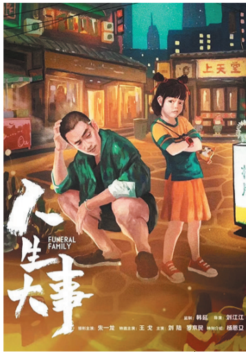
电影《人生大事》海报。