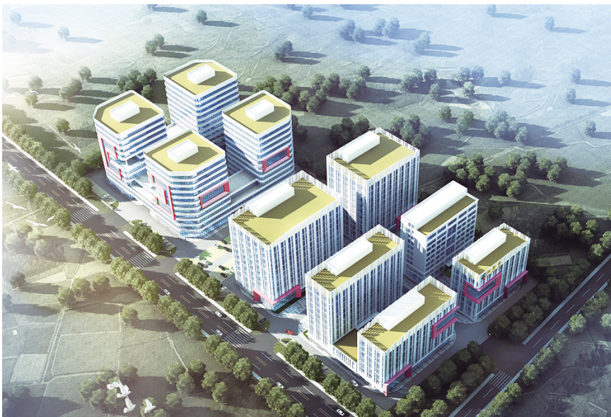
利康源医疗科技产业园效果图。

以青岛光电产业园项目、宇隆光电科技项目等为代表的8个半导体及光电显示产业项目总投资399亿元。其中,青岛光电产业园项目总投资逾300亿元,入园产业项目涵盖光电显示新材料、高端装备研发制造等领域,将进一步延展新区半导体及光电显示产业链。以青岛海上风电及牧场融合发展项目、亿航智能无人机项目等为代表的8个空天海