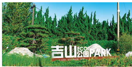
改造后的吉山公园入口。

《青岛西海岸新区城市更新和城市建设三年攻坚行动方案(2022—2024年)》工作部署,公园城市建设以绿化为民、绿化惠民为宗旨,着重在做精、做细、做美、做韵上下功夫,处处彰显便民亲民的特色。坚持绿地总量增加和现有绿地利用改造并举,提升生态绿化,持续改善生态环境。