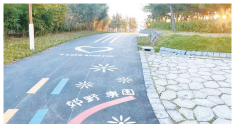
改造提升后的徐山文化公园。