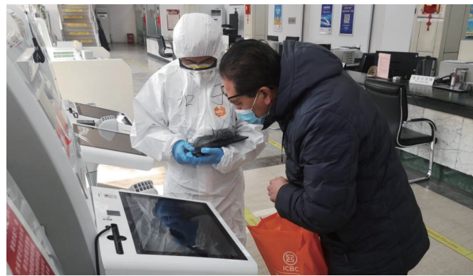
莱西支行营业部人员指导客户使用智能设备。

为某建筑央企成功发放3亿元应急贷款；一天内为莱西市某重点食品企业新增1亿元授信额度，以高效信贷服务支持民生物资供应企业和防疫抗疫企业生产运营，以实际行动展现“工行速度”。