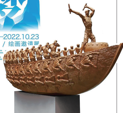
参展作品《同舟共济》(魏小明)。