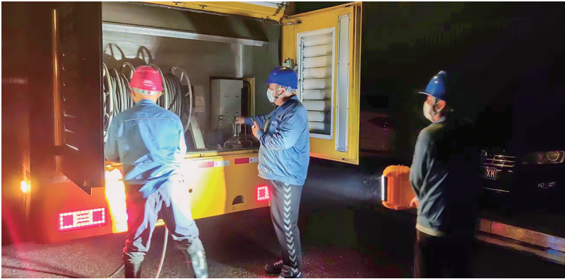
供电公司工作人员连夜抢修线路。

早报9月16日讯 受今年第12号强台风“梅花”影响,16日0时30分,即墨区龙泉街道10千伏玉汽线断线,10千伏海玉线陪停抢修,由该线路供电的即墨一汽大众人才公寓防疫隔离点受到影响,为保障隔离点正常用电和凌晨核酸检测正常进行,公司立即组织输配电运检中心、龙泉供电所11名抢修人员赶赴现场,同时安排发电车同步到位待命,为客户用电提供“双保险”。经过两个小时抢修,凌晨3时,10千伏玉汽线顺利送电,共更换240绝缘导线80米,更换接引线并清理了现场树障。