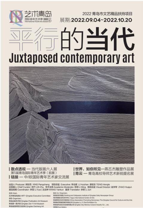
第五届青岛国际青年艺术季海报