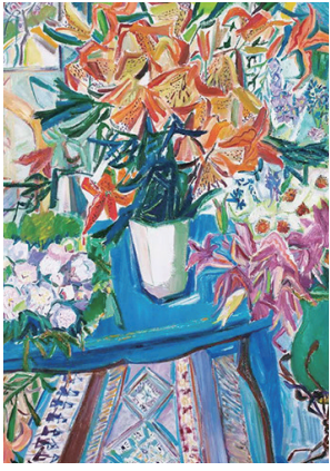
丁红作品《繁花似锦》