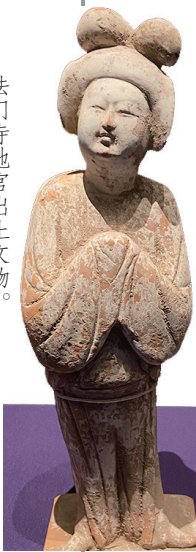
法门寺地宫出土文物。