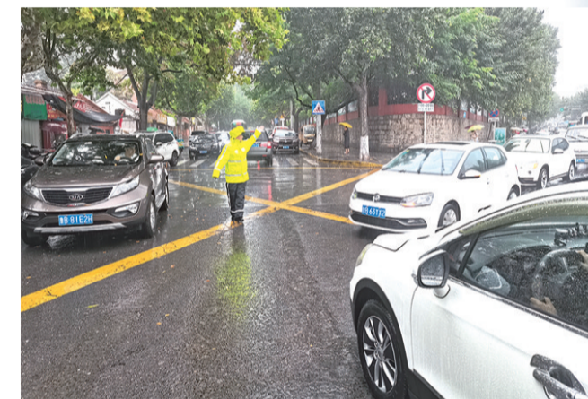
交警在辖区易积水路段进行疏导和调流。