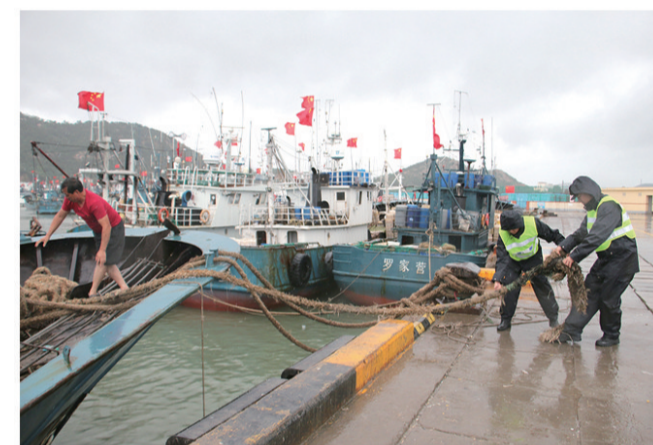
灵山岛派出所民警加强巡逻。