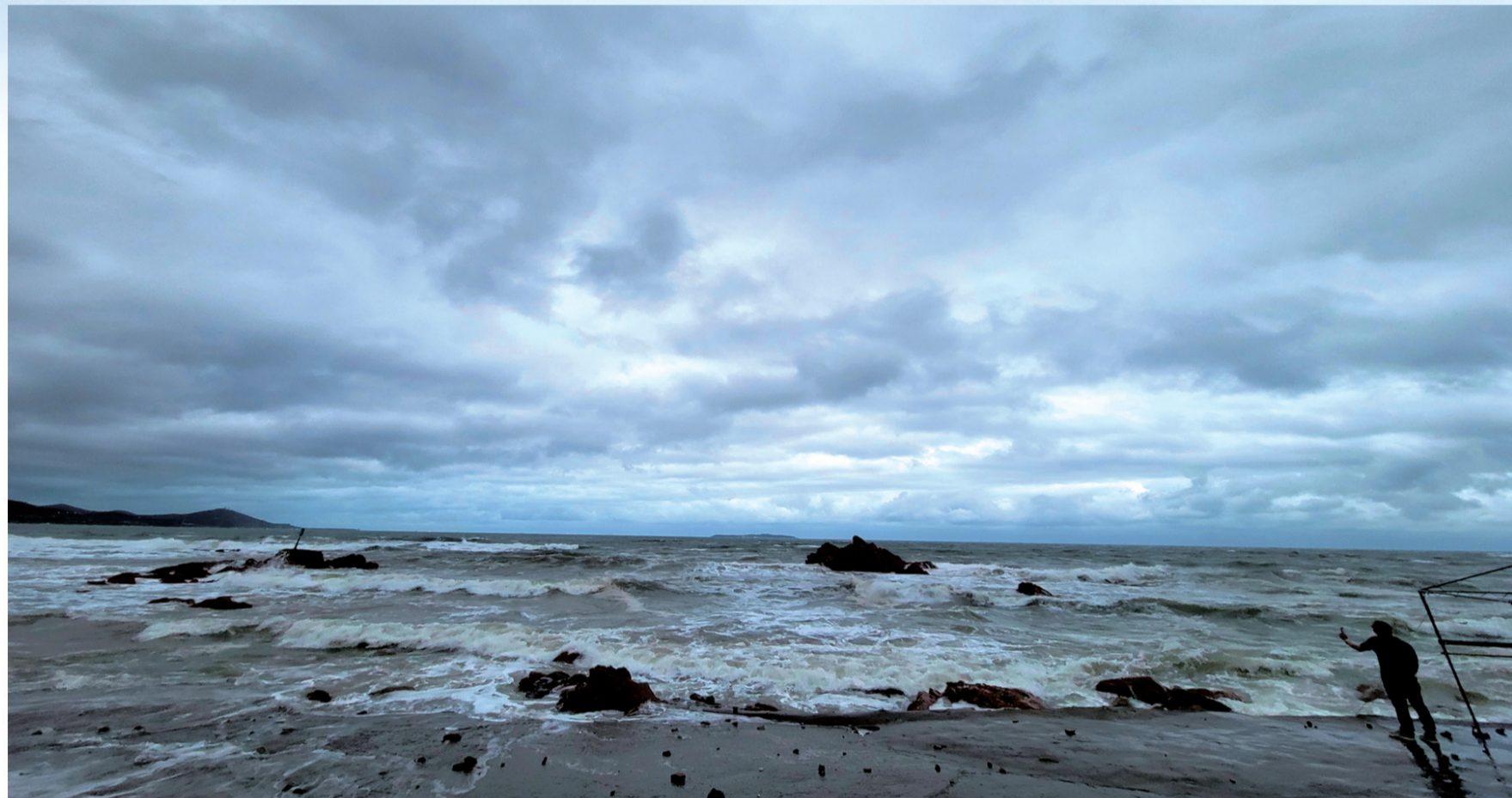
昨日下午6时许,记者在金沙滩景区看到,因风急浪高,沙滩上已经拉起警戒线。天空乌云密布,海上白浪滔天。