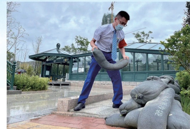
青岛地铁工作人员搬运防汛沙袋。