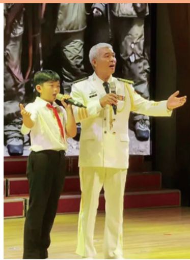
多彩的文艺活动丰富老年人生活。