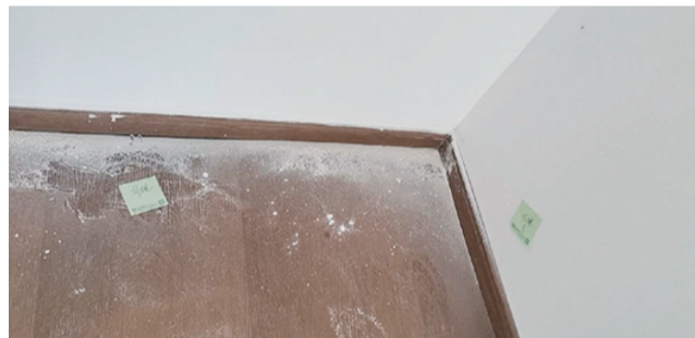
主卧地板吐灰严重。