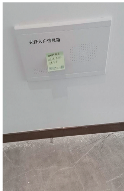
墙弱电箱内插座固定不牢,电线未安装套管。