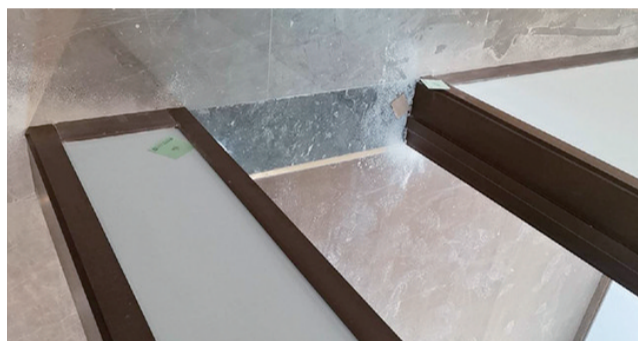
卫生间门口右侧墙面破损一处。