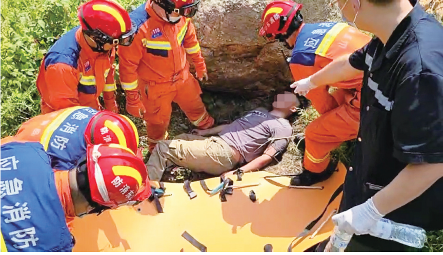
消防救援人员利用担架合力将昏迷伤者抬下山。

相似的救援事件,于9月4日再次发生。当天20时05分,青岛红十字蓝天救援队接到市民求助电话,崂山把刀涧附近有人迷路摔伤,需救援。救援队立即