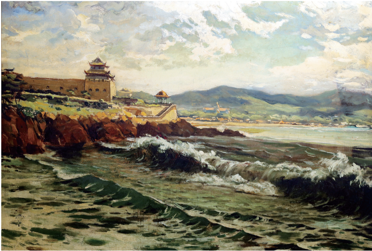
吕品先生油画《水族馆》。