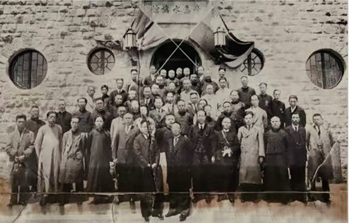
青岛水族馆落成留影。