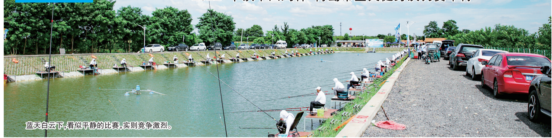
蓝天白云下,看似平静的比赛,实则竞争激烈。