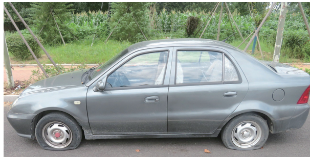
李某开的第二辆车轮胎被割破。