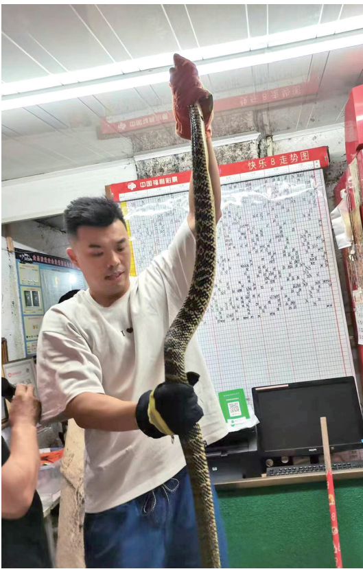
捕蛇人捉住大蛇。