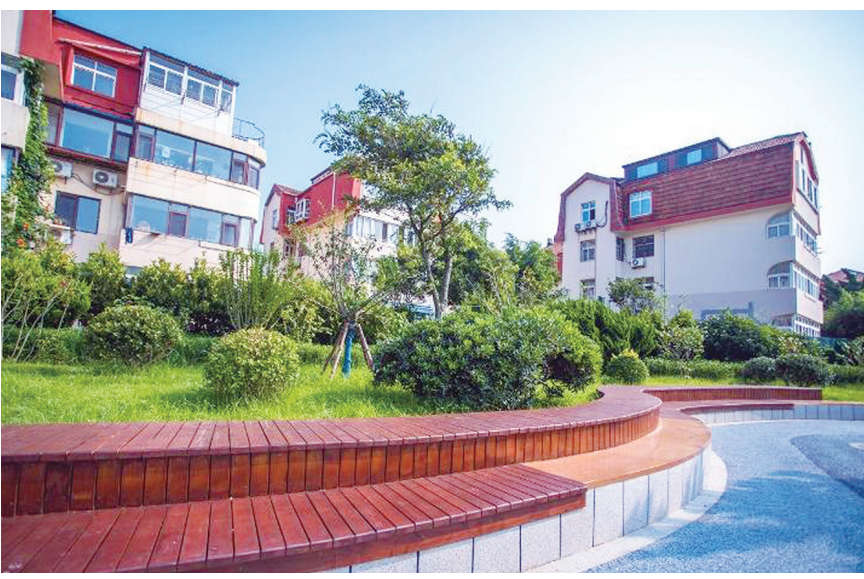
西陵峡路变成美丽花园。

早报8月17日讯 17日上午,青島·上合之珠国际博览中心推介会在北京上合组织秘书处举行。上合组织国家驻华使节、国内外经济机构及企业家代表等60余位海内外嘉宾相聚北京,共叙友情、共话合作、共谋发展。上海合作组织副秘书长索海爾·汗出席推介会并致辞。上合示范区党工委副书记、管委会常务副主任李刚作上合示范区及青島·上合之珠国际博览中心专题推介。 打造上合示范区标志性项目 2018年6月,上海合作组织成员国元首理事会第十八次会议在青島召开,中国—上海合作组织地方经贸合作示范区“落子”青島。李刚在推介中表示,自启动建设以来,上合示范区主 动融入和服务上合组织建设发展,全力推进国际物流、现代贸易、双向投资合作、商旅文交流发展“四个中心”和上合组织经贸学院建设,累计开行国际班列超2000列等。此次推介的青島·上合之珠国际博览中心,是山东省和青島市在更大范围、更宽领域、更深层次推动上合组织及“一带一路”沿线国家间多双边资本、技术、人才深度交融的点睛之笔、经典之作,是上合示范区标志性项目。 搭建开放合作新平台 青島·上合之珠国际博览中心建筑面积约16.88万平方米,融合会议会展、观光旅游、商品展销、文化交流、商事服务等功能于一体,由综合馆、上合元素文 化展示区、多功能馆、中心广场四部分组成,致力于搭建面向上合组织开展多双边交往活动的重要平台载体。 其中,上合元素文化展示区作为博览中心最重要的组成部分,将为各上合组织国家提供展示馆,集中展示各国历史、文化、艺术、民俗等生活场景和特色元素,结合数字光影,实景式呈现上合组织国家浓郁人文风情,展销各国特色商品,促进上合组织国家历史人文交流。 青島·上合之珠国际博览中心将以市场化运作为导向,延展出“展、商、旅、文”四大经营特色方向,打造中国首个“展商旅文”新综合体和文化新场景体验空间,打造全国首个上合国家文化体验基地、全国首个上合主题商业综合体、青少年国际研学基地、城市微度假首选目 的地等。 将于9月30日启动运营 值得一提的是,青島·上合之珠国际博览中心将于9月30日启动运营,并举办上合示范区成就展、上合国家文艺展演、上合国家美食节、上合国家风情摄影展等系列活动。 未来,上合示范区将依托青島·上合之珠国际博览中心这一载体,积极推动中国—上海合作组织数字贸易论坛、中国—上海合作组织地方经贸交流座谈会、“新伙伴、新机遇、携手向未来”牵手上合经贸交流洽谈会、跨国公司领导人峰会等一系列重大活动在上合示范区举办。 (观海新闻/青报全媒体记者 锡复春 通讯员 王沛沛 陈娜)