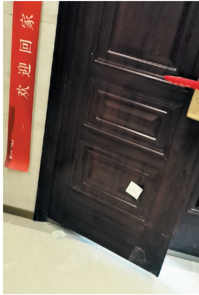
入户门下侧有划痕。