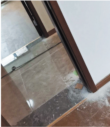
次卧木地板东北角软塌。