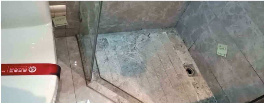
卫生间地漏缺盖板。