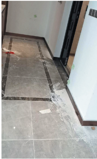
入户门右侧踢脚线收口粗糙。