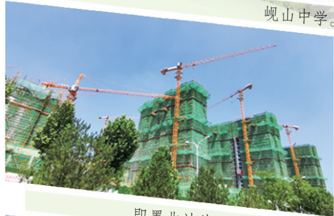
即墨北站片区改造建设现场。