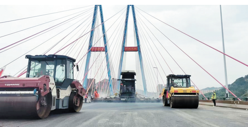
丹山大桥西半幅主线施工现场。

早报7月31日讯 7月31日,伴随最后一车沥青混凝土缓缓落下,青银高速公路丹山大桥西半幅主线顺利完工贯通,现场有序调流转场至丹山大桥东半幅施工,整体施工工期较原定工期提前了13天。当前,项目建设者们正战高温、抗雨季、赶工期,不断刷新项目建设“进度条”,力争8月下旬全幅贯通。届时,可有效改善道路的平整度和抗滑性能,优化路面技术状况指标,进一步提升市民驾驶体验、出行安全和通行效率,让市民出行更安全、更舒适、更顺畅。 G20青银高速丹山大桥段作为进出青岛主城区的重要“门户”,目前日均通行交通量已达9万辆次,日均通行交通量高达63万辆次,是我省车流量通行最大的路段。自建成通车以来,随着使用年限的增长,交通量大幅增长,丹山大桥段已出现纵横向裂缝、块状裂缝等不同程度的病害,常规的小修保养已难以满足行车舒适性及安全性的需要。7月