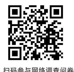
扫码参与网络调查问卷

采取双洞、双向6车道规模。项目的建设主要为完善城市路网,均衡城市交通分布,服务居民交通出行,促进城市长远发展。 记者了解到,公示之日起30日内(7月31日-8月29日),市民如有意见及建议可通过电话(0532-67783725)、传真(0532-67783725)、电子邮箱(qdzj07@163.com)、纸质邮件(通信地址为青岛市澳门路121号甲青岛市住房和城乡建设局)、网络问卷等任何一种途径反馈,电话开放时间为工作日上午9:00-12:00,下午1:30-5:30。 (观海新闻/青岛 早报记者 刘鹏)