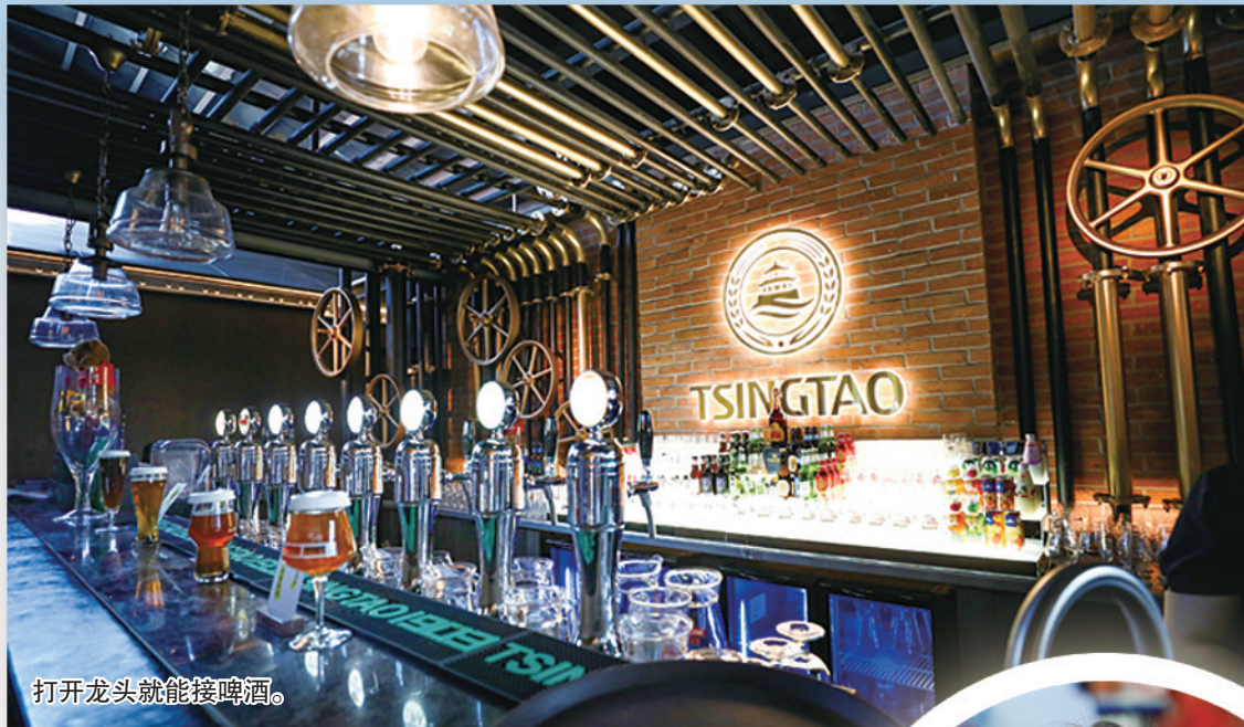
打开龙头就能接啤酒。