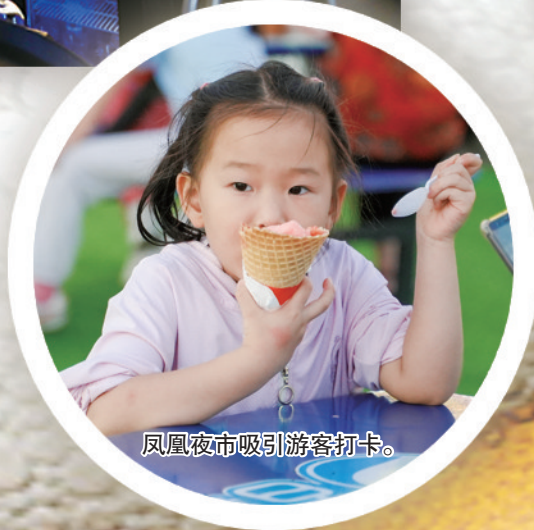
凤凰夜市吸引游客打卡。