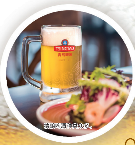
精酿啤酒种类众多。