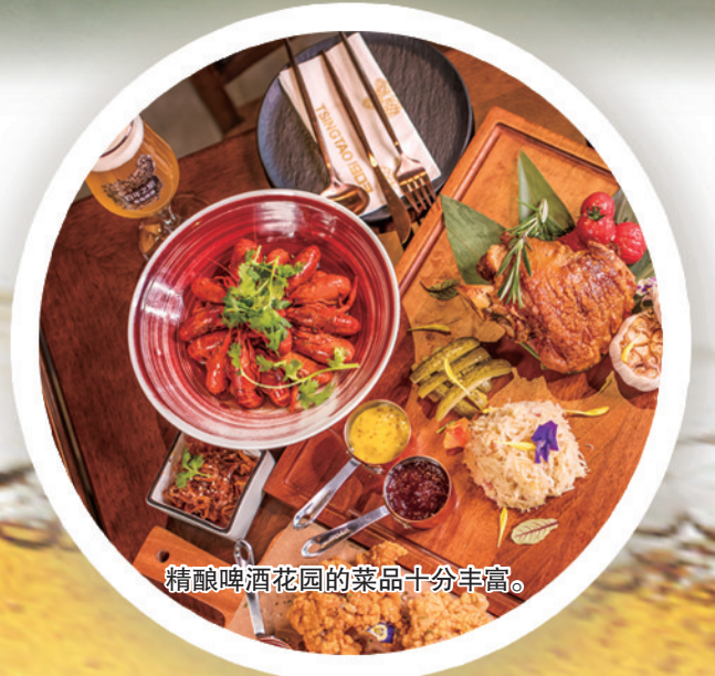
精酿啤酒花园的菜品种类丰富。