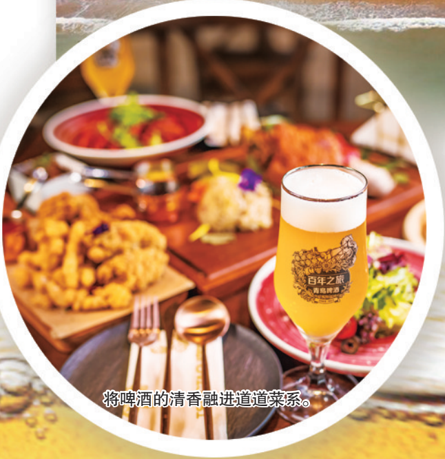
将啤酒的清香融进道道菜系。