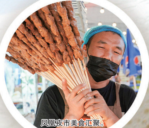
凤凰夜市美食汇聚。