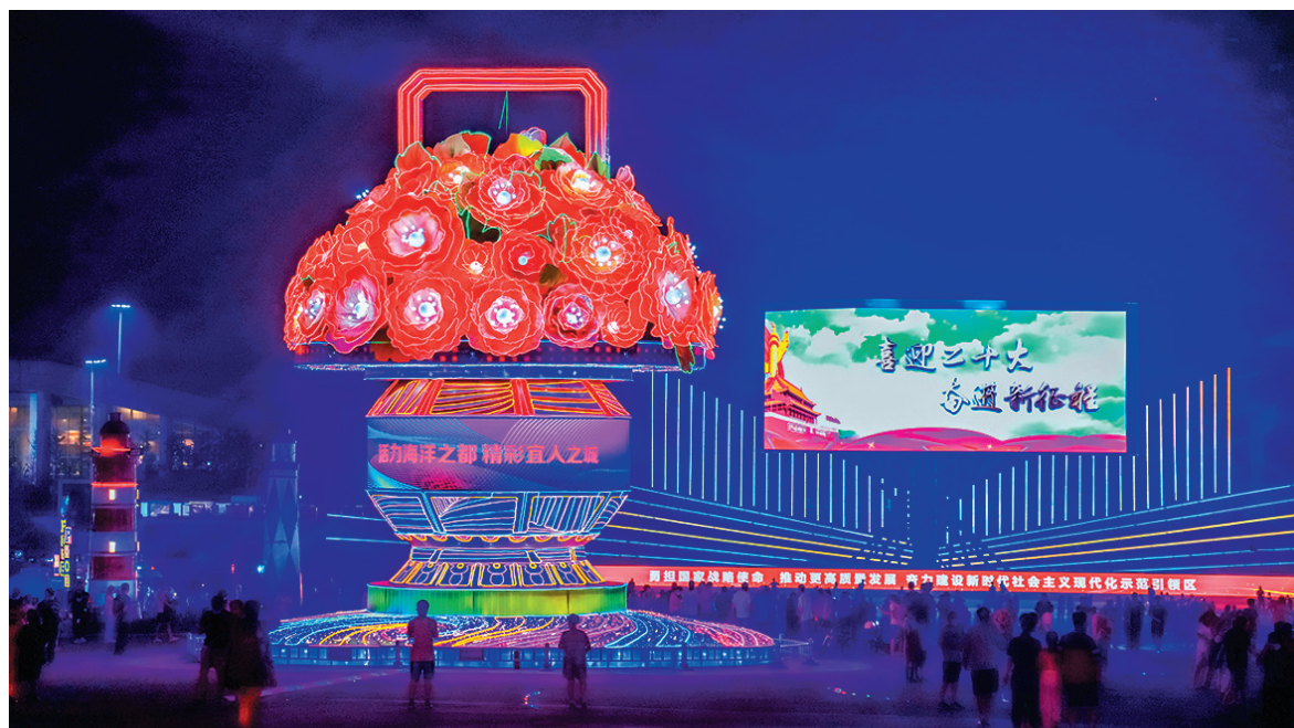
星光大道上的庆典花篮灯组。

观海新闻/青岛 早报记者 张孝鹏 实习生 潘颖文 周贻凡 苏欣然