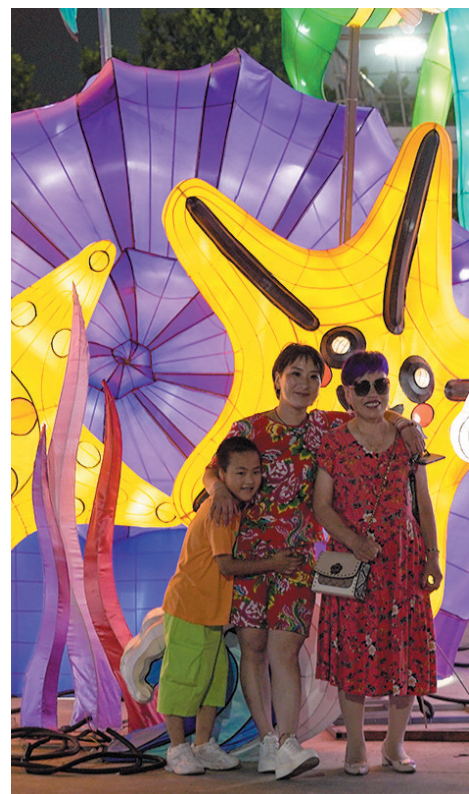
游客打卡海洋主题拱门灯组。