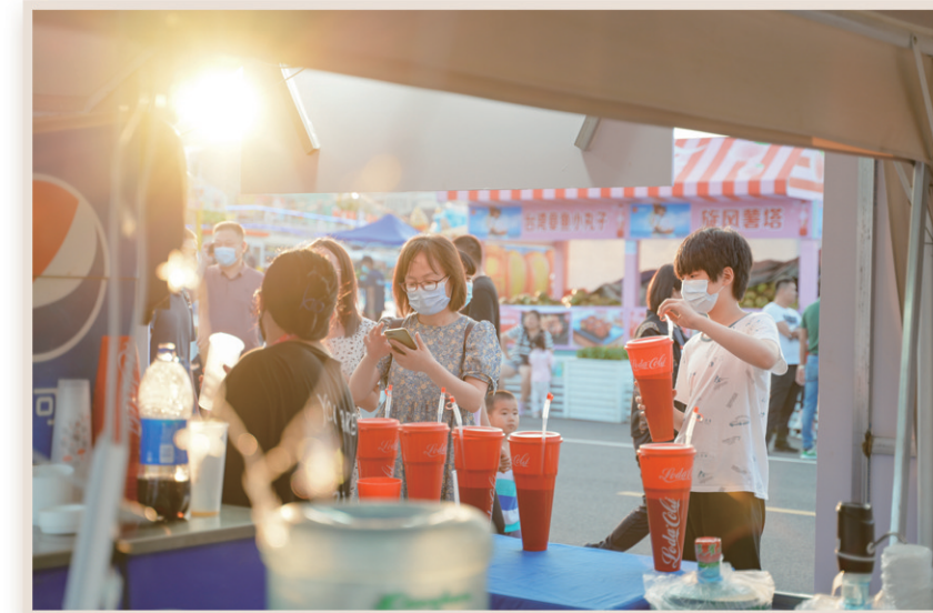
金沙滩啤酒城文创市集。

本版撰稿 观海新闻/青岛早报记者 张孝鹏 实习生 潘颖文 周盼凡 苏欣然 通讯员 丁霞 封宇泽