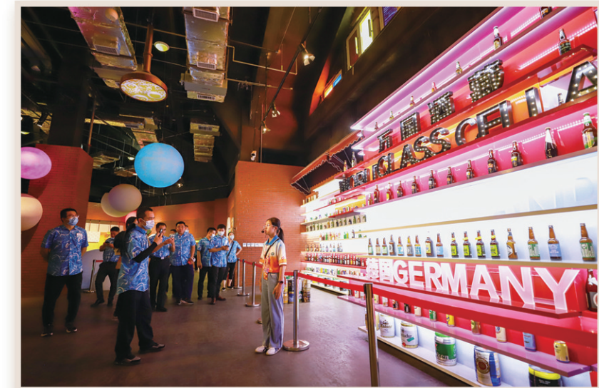
游客参观啤酒文化博物馆。