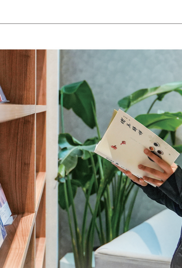
游客在“不是书店”看书。

本版撰稿 观海新闻/青岛早报记者 张孝鹏 实习生 潘颖文 周盼凡 苏欣然 通讯员 丁霞 封宇泽