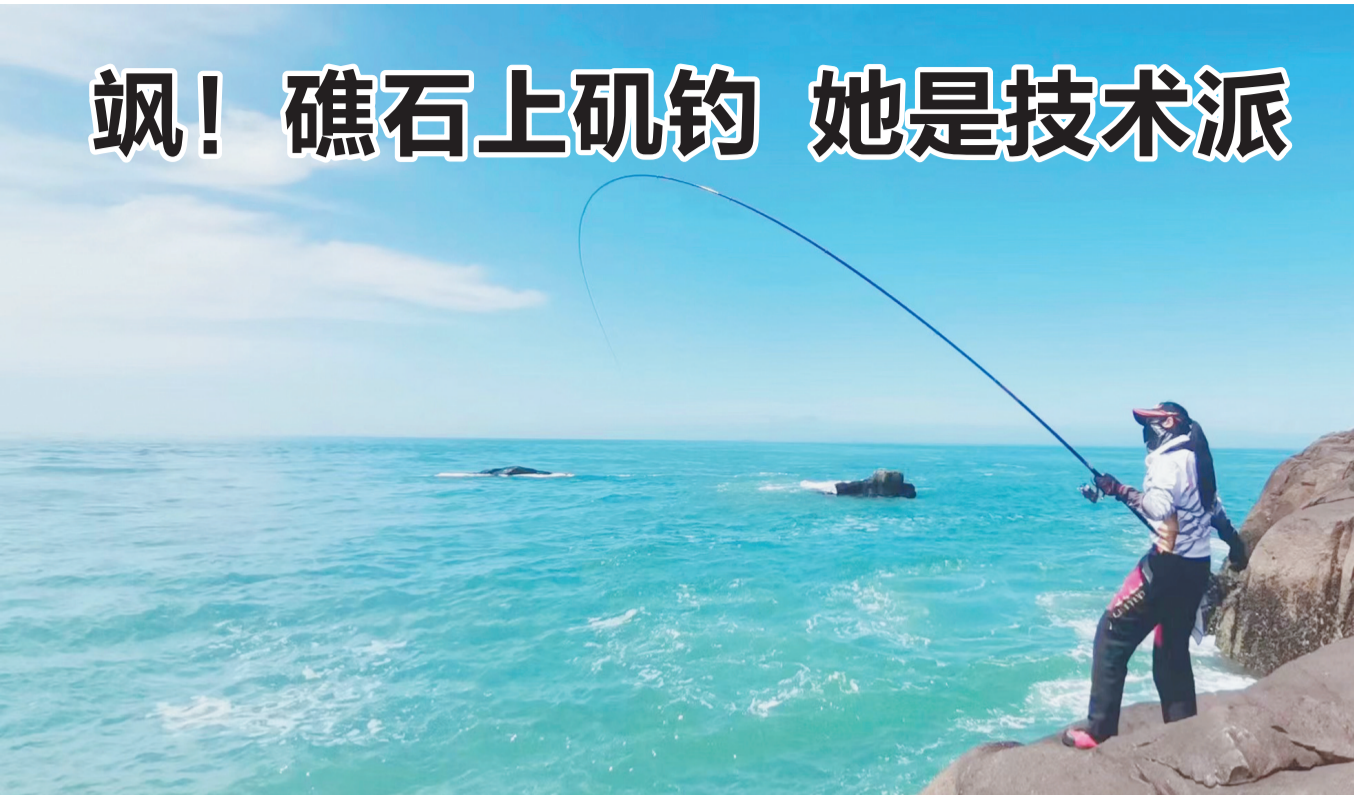
在舟山群岛玩矶钓的小姐姐,真飒。