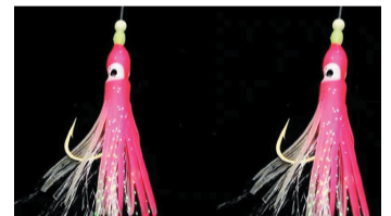
观海新闻/青岛早报记者 李宗宗 通讯员 蒋南

6、仿生饵:游动时更加逼真,诱鱼能力强。比如,粉红色夜光仿真小章鱼(下图),在幽深的海水里具有很强的夜光效果,对付带鱼、鲅鱼等掠食性鱼类效果极佳。