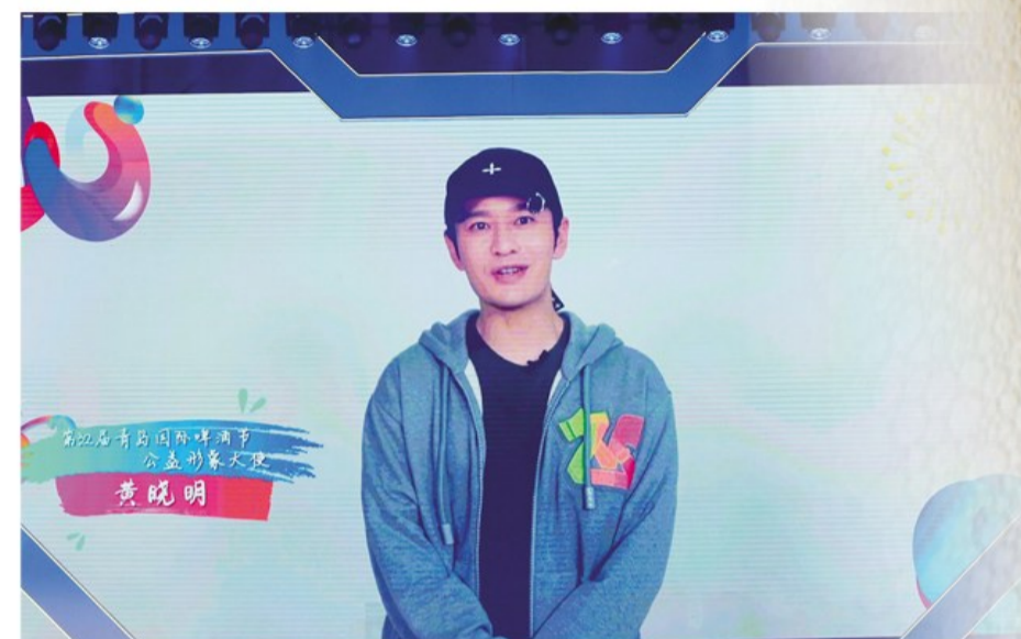
黄晓明通过视频发来祝贺。