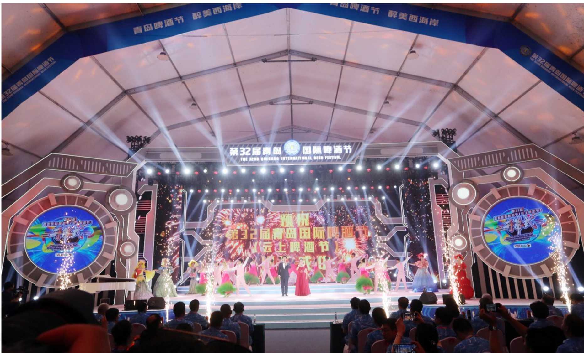
第32届青岛国际啤酒节(云上啤酒节)在西海岸新区开幕。