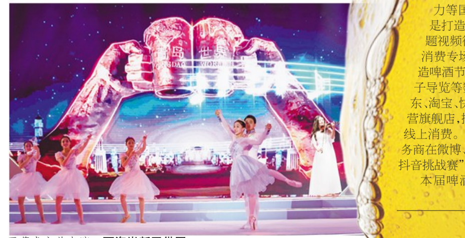
开幕式文艺表演。