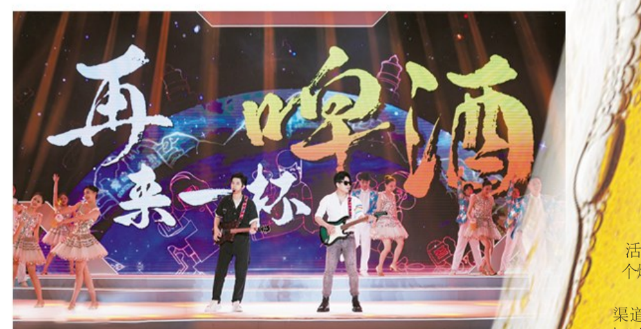
开幕式现场。