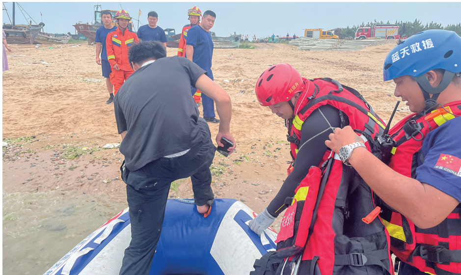
蓝天救援队将被困游客(穿黑衣者)救出绿岛。