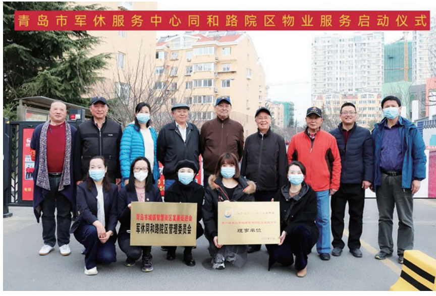
青岛市军休服务中心同和路院区物业服务启动仪式现场。

根据军休干部身体机能特点,中心围绕疏通军休干部的堵点发力,聚焦老年人安全、健康等功能性需求,以“居家环境改善、室内行走便利,如厕洗澡安全、智能监测跟进,辅具配备到位”等为目标,积极链接社会适老化改造资源,向军休干部开展家庭适老化改造政策宣讲工作,为部分有需要的军休干部推荐包括