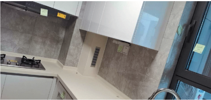
厨房插座松动两处,油烟机漏风。