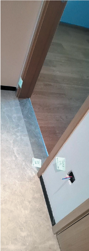
过道踢脚线收口,缺失小夜灯。