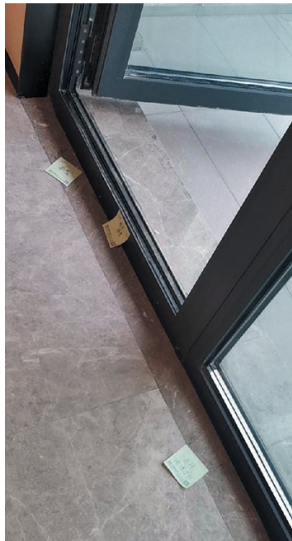
▲阳台过门石破损一处,断裂一处,砖缝未补。