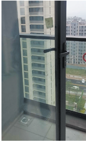
阳台门扇关闭不了。