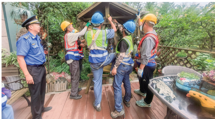
综合行政执法人员组织工人拆除违法建筑。

崂山区综合行政执法局研究出台《崂山区市容秩序管控长效机制工作方案》，聚焦市容秩序显性问题发起攻坚，