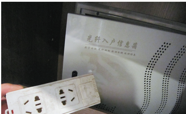
多媒体信息箱配备插座未连接电源。