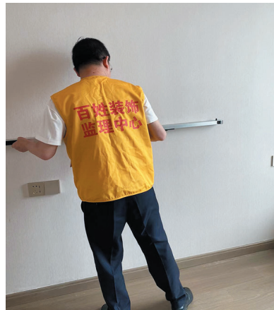
验房师测量墙面平整度。

嵌缝粗糙。阳台太阳能热水器未连接进出水管。主卧还发现窗台板与墙面壁纸开胶的问题,室内壁纸墙面污染多处。