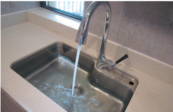
厨房下水顺畅,无渗漏现象。

另外,门厅地砖划伤1处,客厅与走廊处地砖损伤一处,客厅波达线对角拼图错误,阳台地面砖嵌缝粗糙,厨房部分