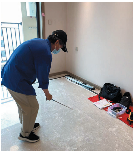
敲击地砖查验空鼓。