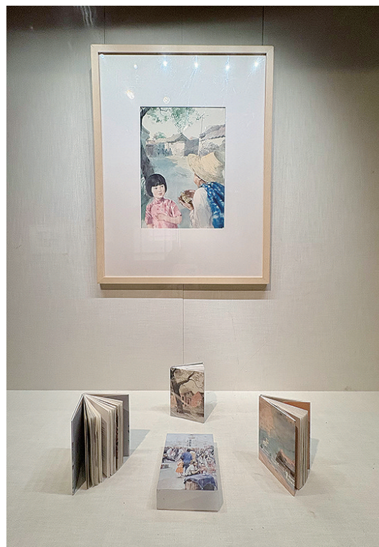
《城南旧事》展览部分也有一段青岛故事。