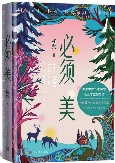
柳营 著 人民文学出版社 2026年6月出版

《必须美》没有宏大的叙事,只有母女之间真实的对话、林间散步的思考、对家族往事的回溯,以及一个母亲如何在与孩子的陪伴中重新学会生活。正如柳营在书中所写:“即便是临时的家,也要美起来,而且必须美起来。即便是生活不如意的时候,我们也要有勇气向光而行。”