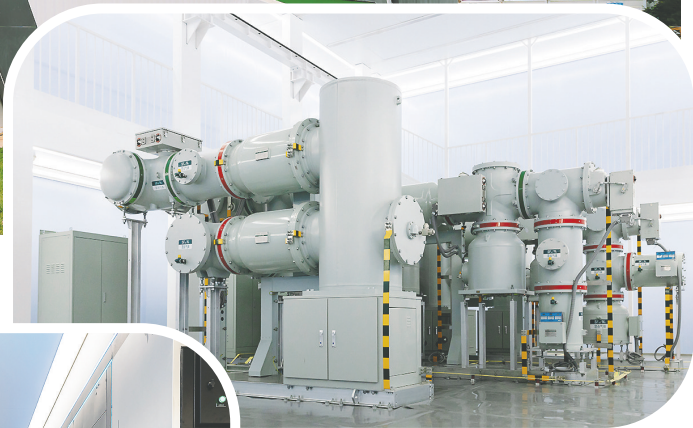
算电岛外观及内部情景。