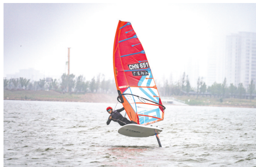
水翼帆板选手在激烈角逐。