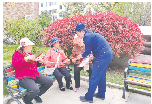
消防宣传员讲解消防安全知识。