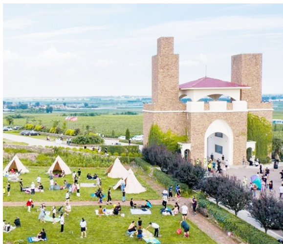
游客在莱西市九顶庄园露营。资料图片