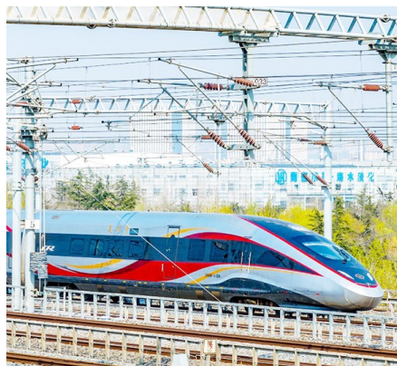
“五一”假期将加开临客。