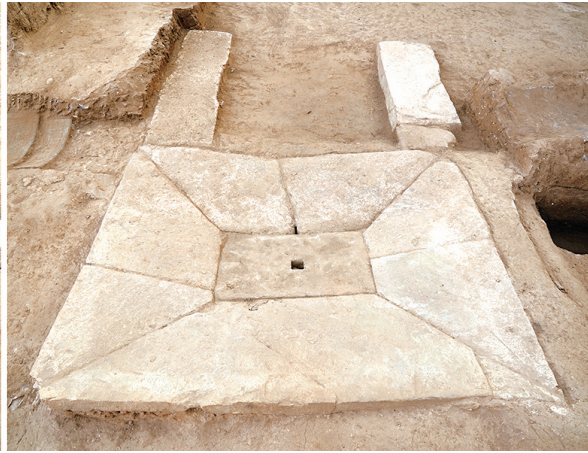
山东青島琅琊台遗址山顶建筑基址发掘出土的排水设施。资料照片