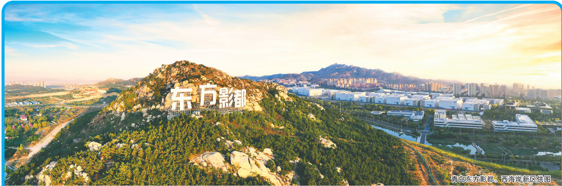
青岛东方影都。