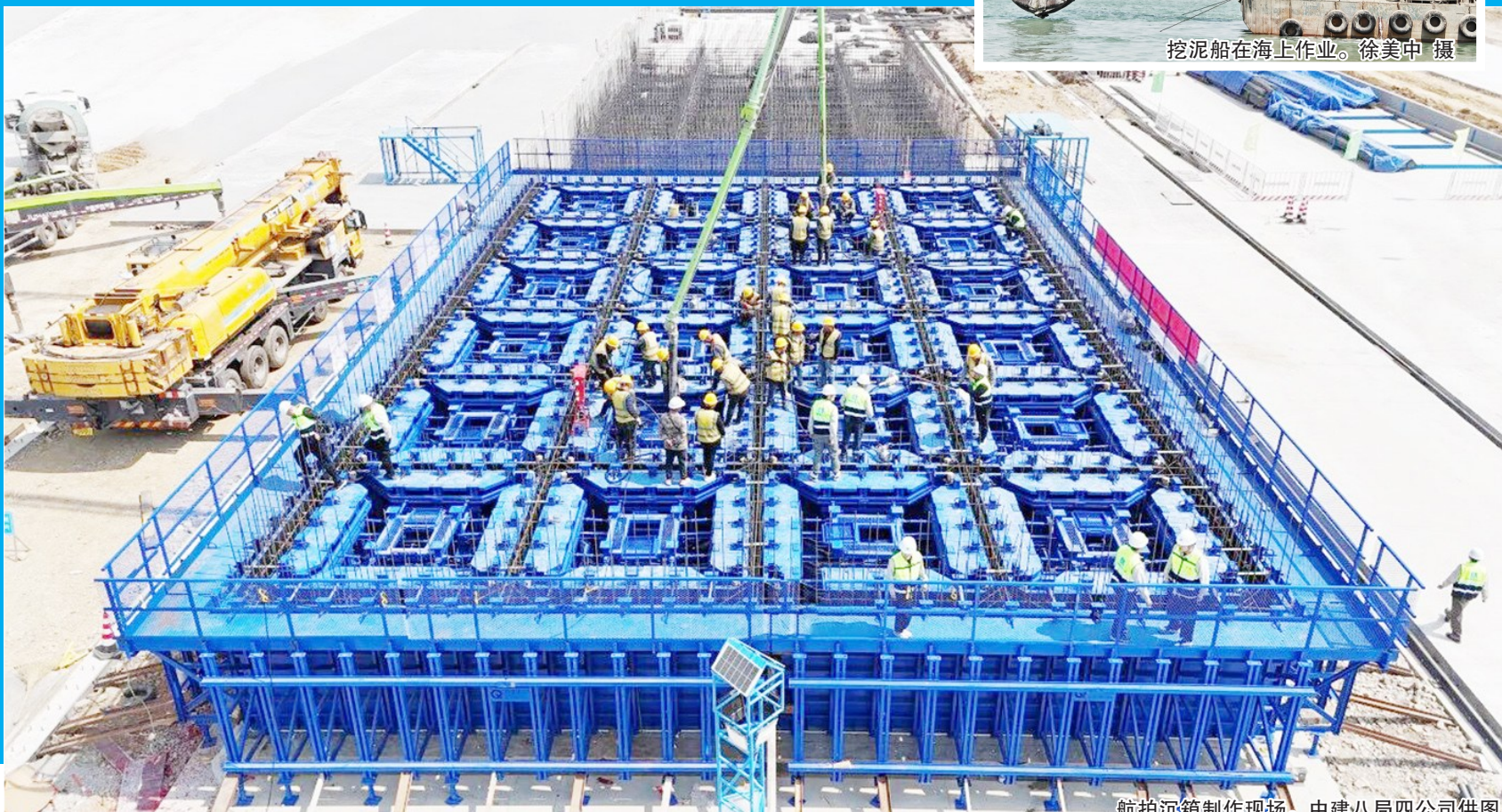
航拍沉箱制作现场。