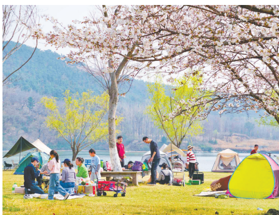
画美达尼青岛市乡村振兴片区。

樱花节配套主题活动同样亮点纷呈、人气爆棚。身着古风服饰的簪花郎巡游队伍缓步而行，头戴繁花、衣袂翩翩，与樱花景致相得益彰，成为林间一道流动的风景；祈福树前，游客们提笔写下心愿牌，将春日期许与美好祝福系于枝头，寄托对生活的热爱。据悉，清明假期园区日均接待游客近3万人次，赏樱观光与互动体验