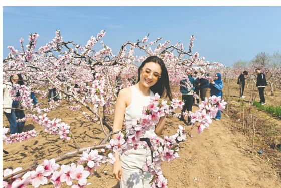
外籍友人在桃园赏花。

作为本次春季文旅活动的“双引擎”，第30届胶北桃花季与第二届“花海里·青岛空港郁金香生活节”相继登场。今年桃花季将实现沉浸式体验、全年龄段覆盖、全时段游玩和服务保障四大升级。核心观赏区定制踏青赏花精品线路，首次推出“桃花杯”篮球联赛、“摩卡桃花杯”青年歌手大赛、乡野桃韵创作笔会等配套活动，并新增“桃夜未央·潮玩夜游”板块，设置非遗之夜、特色美食街区，实现游玩不断档。