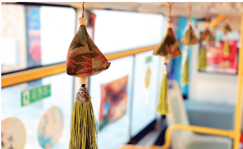
主题车厢洋溢着浓郁的乡村人文气息。

泛绿的田野，便来到藏于艾山脚下的曹家庄。这个静谧的小村庄，如今已成为胶州乡村文旅的“网红打卡地”。