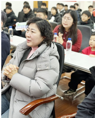
公俐妈妈在青岛第二现场观赛。

当时,轮滑运动在岛城青少年中非常受欢迎,这为青岛短道速滑队的选材提供了新的思路。基于此,青岛短道速滑队决定从轮滑项目入手,经过深入调研、广泛宣传,通过举办一系列轮滑赛事和体验活动,从众多轮滑队员中选拔出了一批具备一定水准和发展潜质的队员,经过系统的冰上转型训练,逐步培养成为专业短道速滑运动员,这一创新举措收效甚广,“轮转冰”