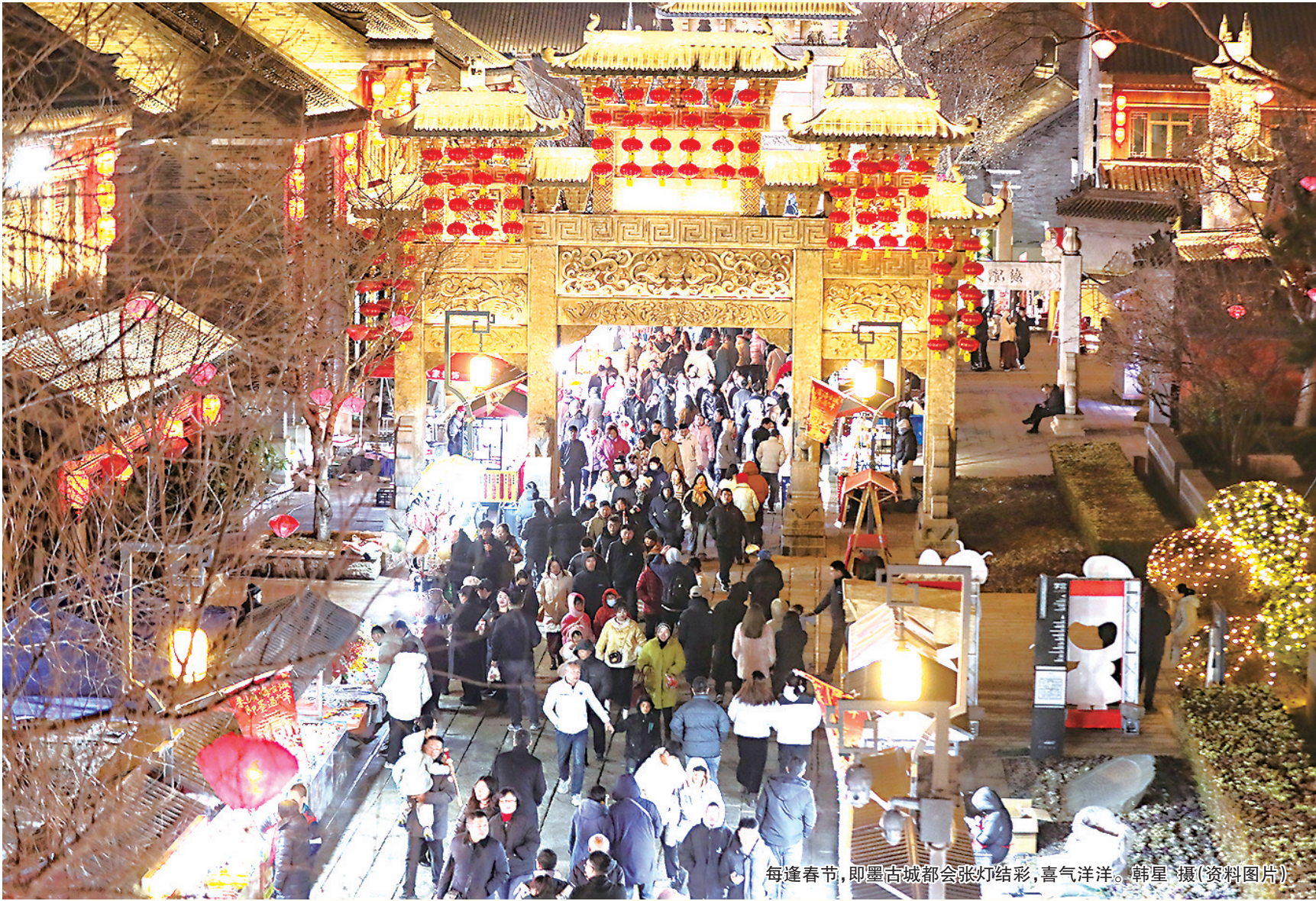
每逢春节,即墨古城都会张灯结彩,喜气洋洋。

2日,我市发布2月文旅消费促进活动计划。市文旅局围绕“岁启新封,春润岛城”主题,聚焦市民游客的文旅体验和消费需求,策划推出312项重点活动,全面营造节日氛围,让市民游客在青岛度过一个富有烟火气、文化味的中国年。