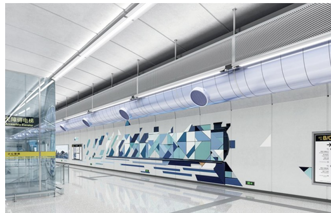
地铁15号线四方厂站《工业新途》。

地铁9号线一期起于海西村站,止于前金社区站,线路全长约16.36公里,均为地下线,共设12座车站,换乘站4