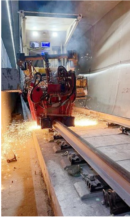
新能源焊轨机。

青岛地铁集团第一建设分公司业主代表张亮表示,青岛地铁集团第一建设分公司深度践行智绿融创高质量可持续发展理念,带领中铁四局大胆引入新能源焊轨机组这一“黑科技”,为移动焊轨作业提供核心动力支持。该设备搭载国际先进的燃料电池技术,从根源