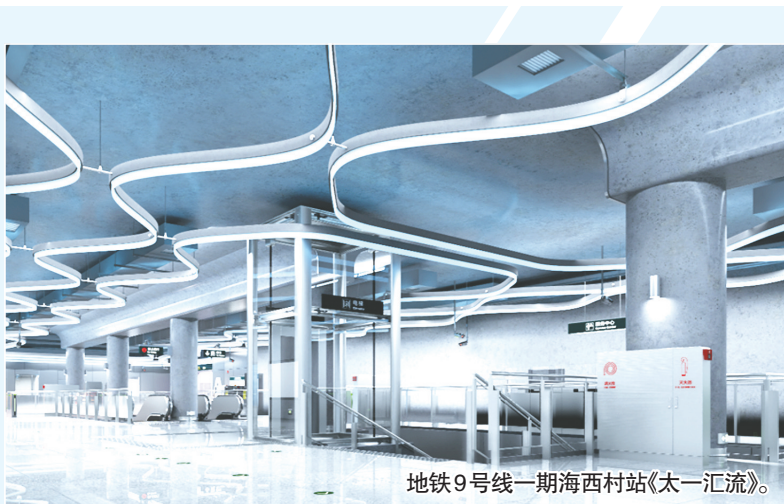
地铁9号线一期海西村站《太一汇流》。

近日,青島地铁集团对地铁5号线、6号线二期、9号线一期和15号线一期工程空间一体化设计方案进行社会公示,欢迎社会各界提出意见和建议。